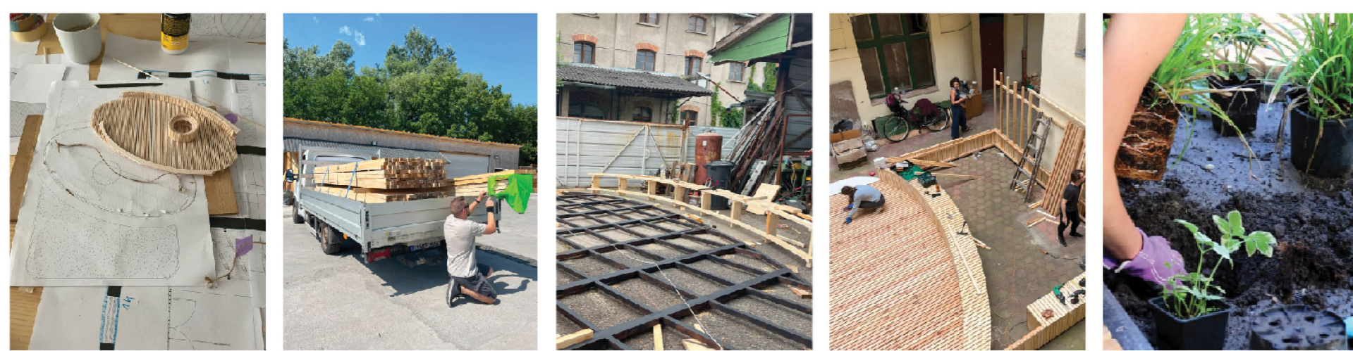
Process of design and self build