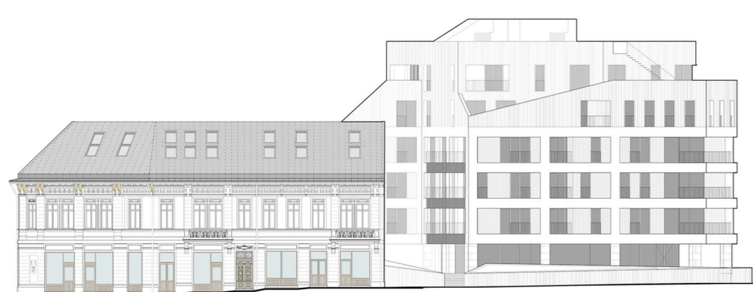
FATAȚA CALEA MOȘILOR